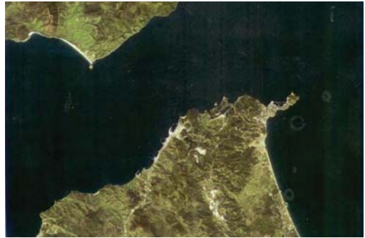
Рис. 6. ТН-1. Гибралтарский пролив. Мультиспектральный снимок в естественных цветах. Разрешение 10 м (2012 г.)