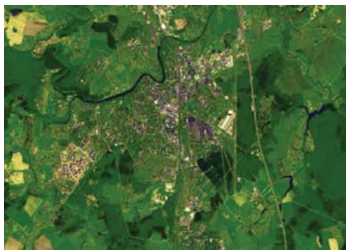
Рис. 2. «Сич-2». Россия, Московская область, г. Подольск. Мультиспектральный режим. Разрешение 8,2 м (2012 г.)

Спутник был выведен из эксплуатации в мае 2013 г. Государственное космическое агентство Украины планирует в ближайшем будущем запустить КА «Сич-3-0» с разрешением лучше 1 м. Спутник создается в КБ «Южное».