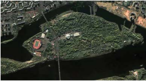
Рис. 1. «Канопус-В». Россия, г. Красноярск. Синтез в естественных цветах. Разрешение 2,1 м

природопользования и хозяйственной деятельности, инвентаризации лесов и сельскохозяйственных земель, других задач.