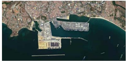
Рис. 3. SPOT-6. Гибралтарский пролив, Средиземное море. Синтез в естественных цветах. Разрешение 10 м (13.09.2012 г.)

Спутники Pleiades-1A и Pleiades-1B синхронизированы на одной орбите таким образом, чтобы иметь возможность обеспечить ежедневную съемку одного и того же участка земной поверхности. Использование космических технологий нового поколения, таких, как оптоволоконные системы гиросtabilизации, дает космическим аппаратам, оборудованным самыми современными системами, беспрецедентную маневренность. Они могут проводить съемку в любом месте 800-километровой полосы меньше чем за 25 секунд с точностью геопозиционирования меньше 3 м (СЕ90) без использования наземных опорных точек и 1 м — с использованием наземных точек. Спутники способны снимать более 1 млн кв. км в день в панхроматическом и мультиспектральном режимах.