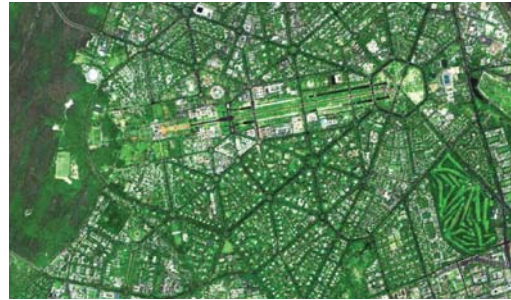
Рис. 5. RESOURCESAT-2. Индия, г. Дели. Мультиспектральный режим. Разрешение 5,8 м (2011 г.)

В дополнение к уже работающим на орбите спутникам в апреле 2011 г. был запущен КА RESOURCESAT-2 , предназначенный для решения задач предотвращения стихийных бедствий, управления водными и земельными ресурсами (рис. 5).