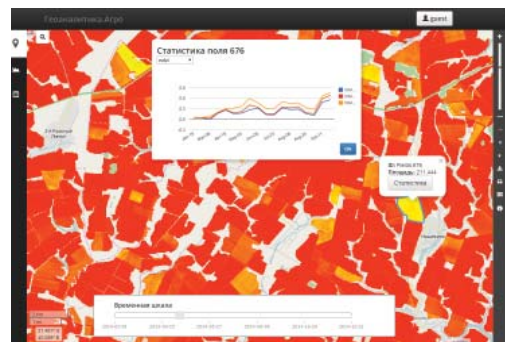
Рис. 2. Интерфейс веб-сервиса «Геоаналитика.Агро»

продуктам, предлагаемых заказчиком (СХД-ГЕО, Геоаналитика.Агро).